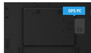
OPS PC SLOT

Die IPS Panel Technologie bietet einen hohen Kontrast und gute Farbbrillanz, bei einem viel größeren Einblickwinkel als bei der standard TN-Panel Technologie.